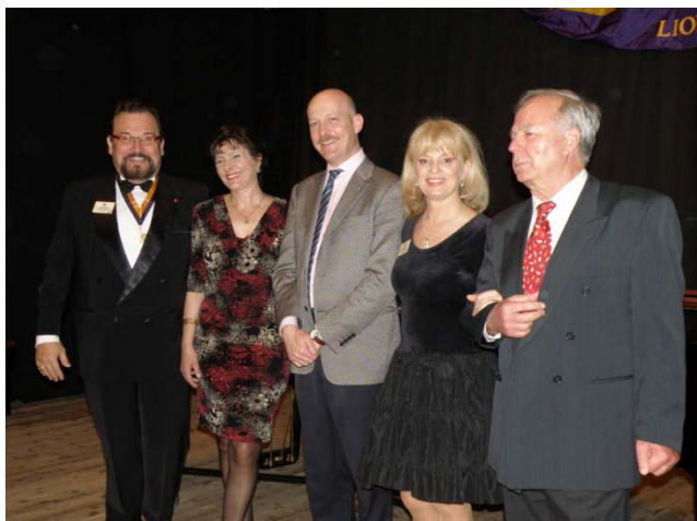
Ocjenjivački sud u Rijeci