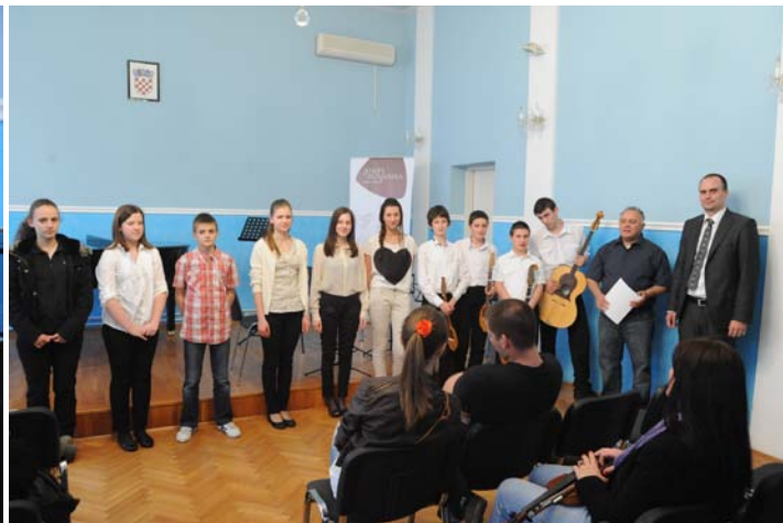
Svi sudionici regionalnog natjecanja u Vinkovcima