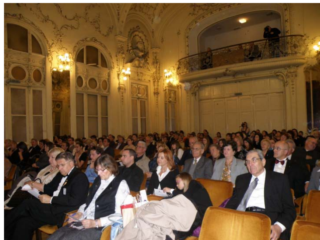
Prepuna dvorana Filodrammatice

U završnici najdugovječnije distriktne aktivnosti nastupilo je petnaestoro vrsnih umjetnika koji su svojom glazbom naprosto oduševili sve prisutne u prepunoj dvorani što su popratile lokalna i nacionalna televizija kao i tisak.